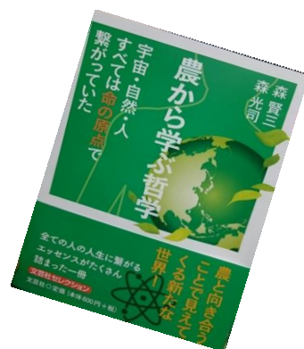
新作『農から学ぶ哲学』（文芸社・2017年5月発売）当日もご紹介