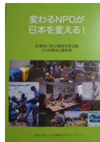
「変わるNPOが日本を変える！」 （一社）日本環境NPOネットワーク

http://www.7midori.org/katsudo/support/leader/bosyuyoko.html