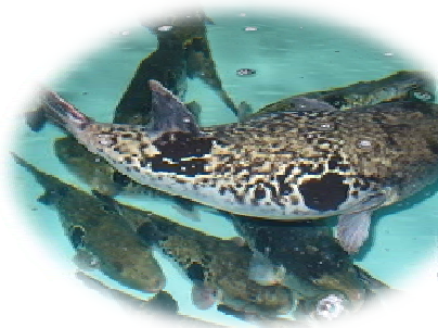
生簀に泳ぐトラフク