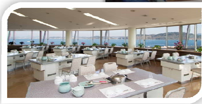
警備をパノラマで眺めての空間で