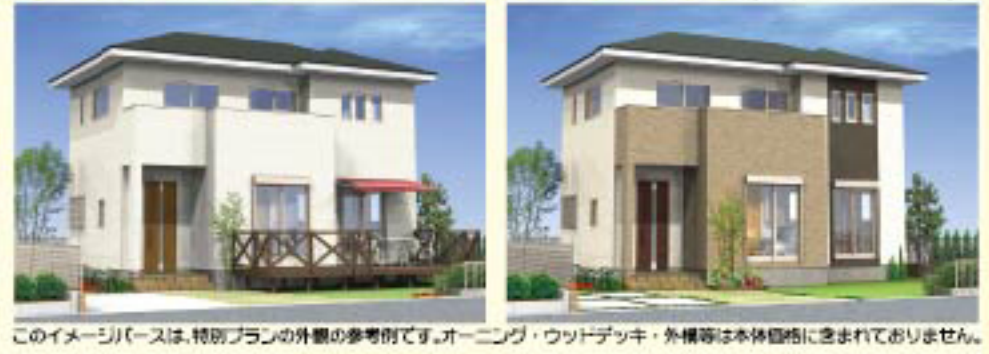
このイメージは、特別プランの外観の参考例です。オーニング、ウッドデッキ、外構等は本体価格に含まれておりません。