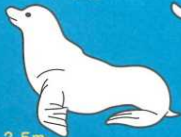
カリフォルニア アシカ