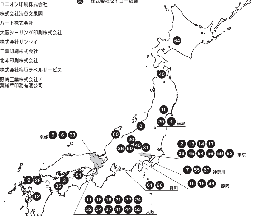
(ナンバー、順序はプース番号順・敬称略 / 11月8日現在)