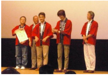
▲球磨焼酎酒造組合より名入りの赤いはっぴと任命書と名刺が渡されました。

若手芸人ツィンテルさんのネタを元に作られました。会話の中に球磨焼酎の銘柄がずらっと散りばめられています♪ あなたは何銘柄わかりますか？