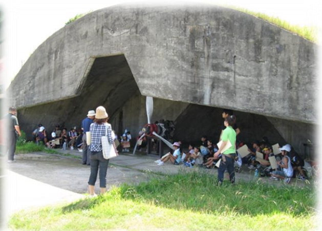
掩体壕での平和学習