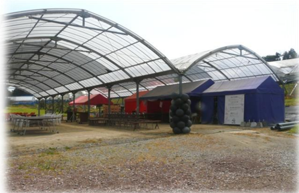
周辺にぶどう畑が広がる屋根付きの会場です