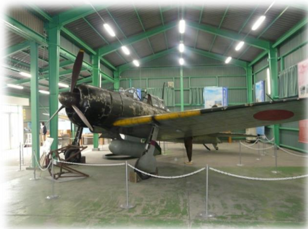
宇佐市平和資料館の実物大零戦模型