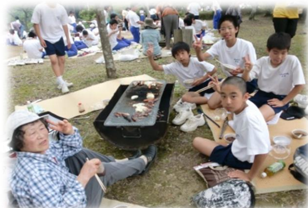
受入家庭・友達同士での交流を深められます