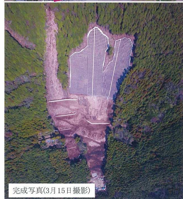
完成写真(3月15日撮影)