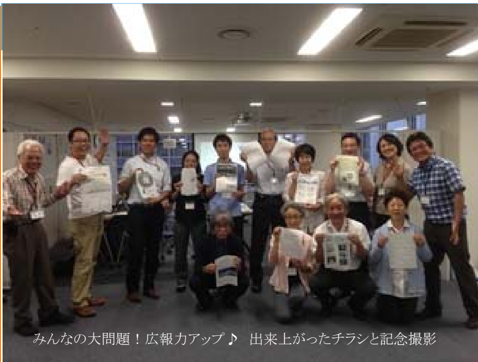
みんなの大問題！広報力アップ♪ 出来上がったチラシと記念撮影