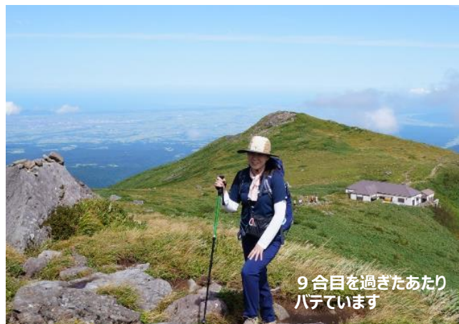
9合目を過ぎたあたりバテています