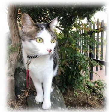
百獣の王 さぶろく (イメージ)