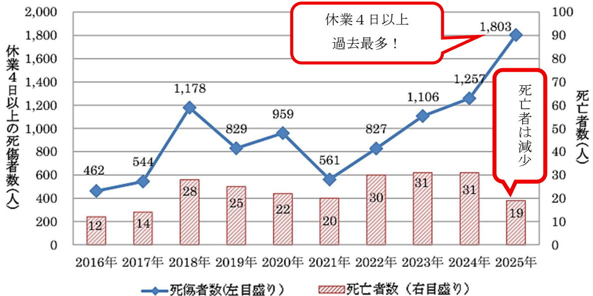
職場における熱中症による死傷者数の推移

休業4日以上以上の疾病者の数は、2024年に比べて約43%増加。これは、 2025年夏の平均気温偏差が+2.36℃と、統計開始以来最高 を記録したためと推測されます。一方、死亡者数は2024年に比べ約39%減少。事業場における熱中症の重篤化防止対策が功を奏したと考えられています。今年の夏も防止対策が肝になりそうです！