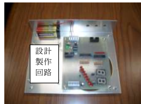
シャーシに取り付けたところ