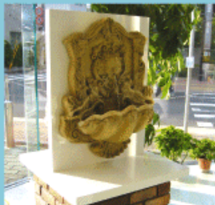
途切れることなく流れる水音も、お客様をリラックスさせる大切な道具