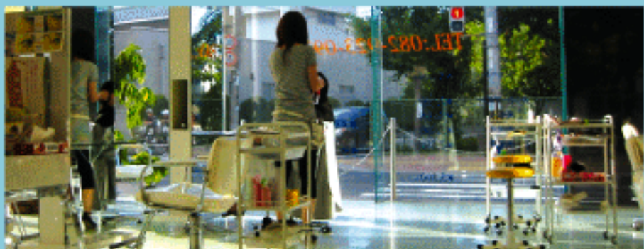
ホワイトで統一されたインテリアにグリーンが美しく映える。車いすでの来店も可能なバリアフリーの設備。