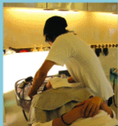
2店舗合わせて23名のスタッフが活躍する。