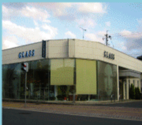
道行く人も足を止めるガラス張りのオシャレ空間。「一度は入ってみたい」そんな気を醸こさせる