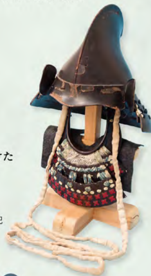
高杉晋作所用 兜 (東行記念館蔵)

幕末期を彩った高杉晋作や彼と関わった人々、そして晋作の法灯を守り続けた 東行庵について紹介します。