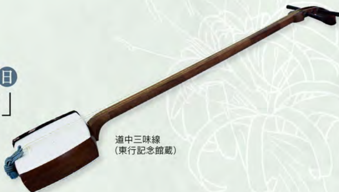
道中三味線 (東行記念館蔵)