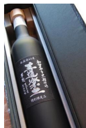
500ml 44度 小売価格 3,150円 (税込)

恒松酒造本店の王道楽土シリーズ。6月7日に今年の初留取りが蔵出しされました。楽天の焼酎部門で1位を獲った人気の王道楽土です。7月に吟王道発売予定。