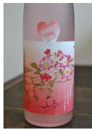
500ml 12度 小売価格 1,050円 (税込)

絶滅危惧種である「つくしいばら」の栽培に成功された大和一酒造元。五月にはハート型の花びらが収穫され、薔薇香酒「つくしいばら」の原料に使われています。