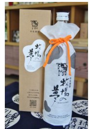
720ml 減圧 25度 小売価格 1,670円 (税込)

大和一酒造元の牛乳焼酎「牧場の夢」に可愛いポーチスタイルが登場。内容・価格はそのまま、従来の商品も併行販売です。飲んでよし、顔や髪につけてもよしと評判の焼酎です。