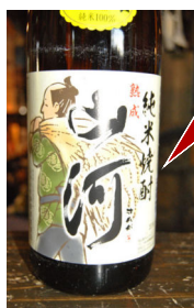
1800ml 減圧 25度 小売価格 1,814円 (税込)