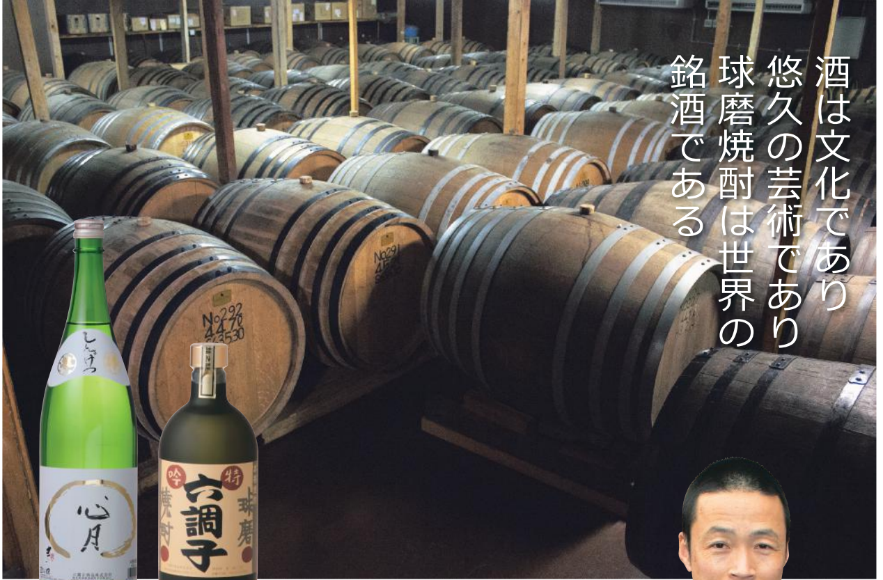
【心月】 球磨焼酎の原点を語る一本。