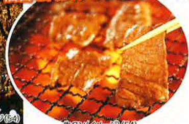
牛タン炙(イメージ)(54)