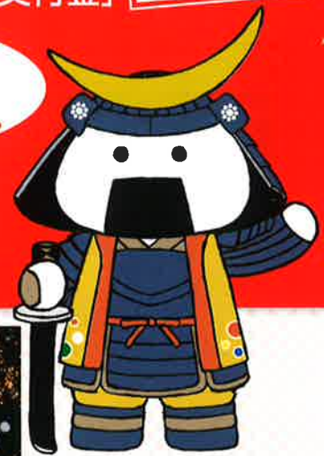
仙台・宮城観光PRキャラクター むすび丸