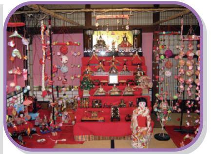
なんと!! 全部で2,000体(驚) 展示してありました。 見事です!!