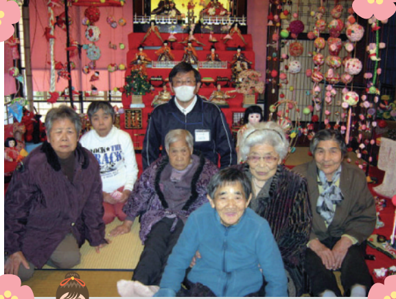
おひなさまの前で… ハイポーズ!!