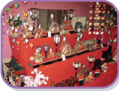
江戸時代のひな人形です!!

2月10日から氷川町のまちづくり酒屋において“ひなまつり展”が開催されました。早速、松山デイサービスでも、2月10日(木)・22日(火)の2日間を利用し、見学に行ってきました!!