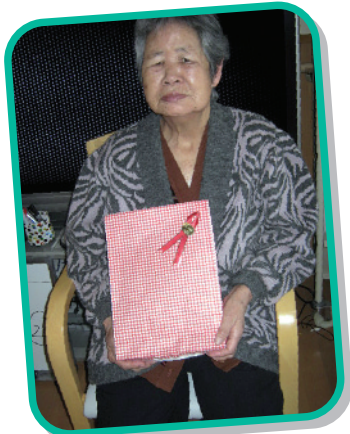
様 3月 日 歳