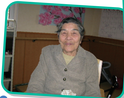
様 3月 日 歳