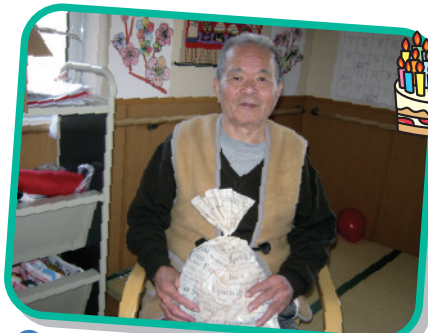
様 3月 日 歳