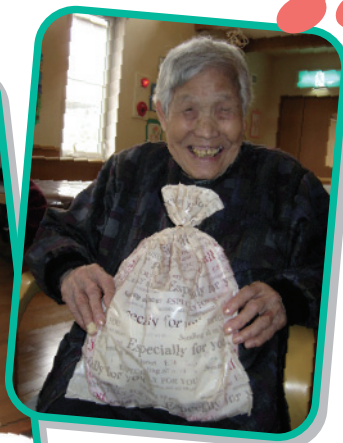
様 3月 日 歳