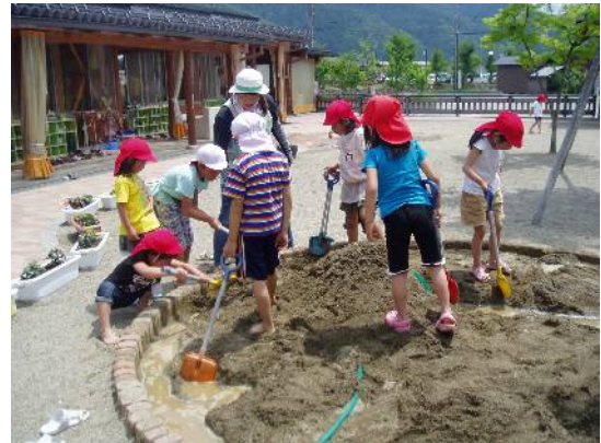
山あり、谷あり楽しい砂遊びワールド