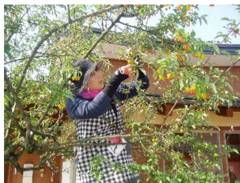
みき先生は脚立で取っています