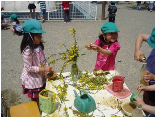
草花遊びを楽しんでいます

15日には神岡町の双葉保育園の年長32人が遊びに来てくれ、上記のような遊びを思いっきり楽しんでくれました。双葉保育園の先生方が、『増島保育園は環境がいいですね～』と感心していかれました。