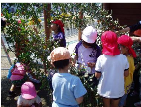
帽子の色は様々。高いところは年長さん 低いところは年少や年中さん

少々しぶいところもあるけど結構はまるようです。1日しっかり収穫しても次の日にはたくさんの赤い実をつけています。※昔はりっぱなミネラル豊富なおやつでした。