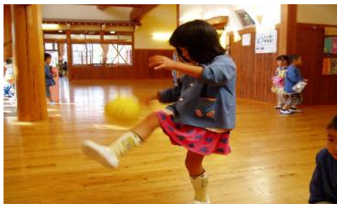
年中の女の子です。まのところで足が上げれます。

『あんたがたどこさ』をマスターしてみよう!と取り組んでいます。年次によって温度差は若干ありますが、上手な子を見て刺激になっているようです。 まりつきは、もちろんおもしろい!というのがありますが、集中力や手足の筋力の強化につながると思います。