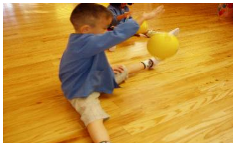
座ってつくのもあり! けっこう足開いています。