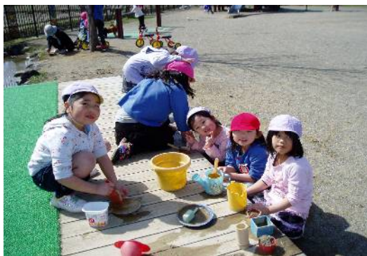
ビオトープの栈橋でおままごと