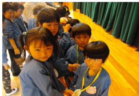
年長さん手作りペンダントをプレゼント