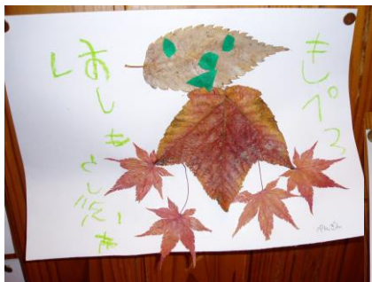
年中さんは画用紙に 落葉で動物作り