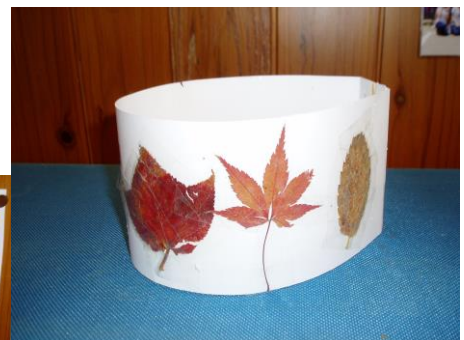
年長さんはかんむりに落葉の デコレーション

子どもたちの遊びを見ていると、時々自分の子どもの頃の記憶が蘇ってきます・・・その時の季節のあそびを思いっきり楽しんでいたあの頃・・・こんな詩が目にとまったので紹介します。