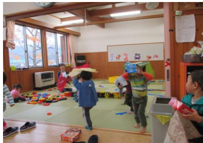
みんなで獅子舞い たのしいな～