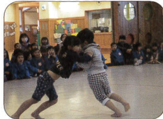
新春ますしま場所

園児向けの図鑑・絵本をお譲りいただける方がいらっしやいましたらぜひお願いします。 平日8時~17時 担当: 洞口