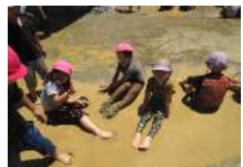
どろんこってきもちいい～♡