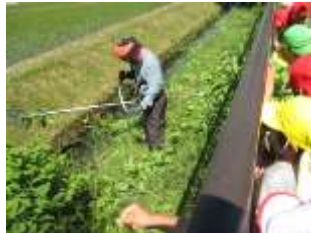
「かまけんのおじちゃ～ん 草刈りありがとう！」