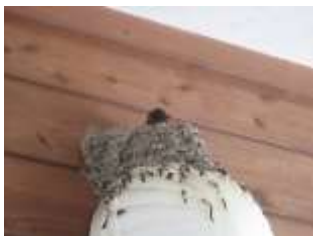
つばめがバス乗り場に 巣をかけています