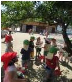
「グミ？先生とって～」 「赤いやつ～」