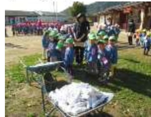
焼き芋…甘くておいしかったね！！