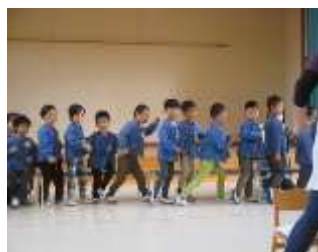
年中ラインダンス