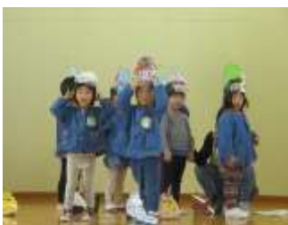
年少「へんしんトンネル」