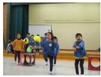
年長「エルマーの冒険」