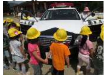
信号をしっかりと見て渡ります。