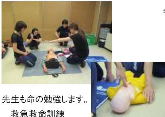
先生も命の勉強します。 救急救命訓練