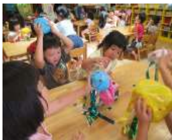
「できた～！！すてきでしょ」