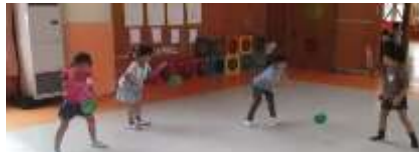
遊んでいるときの笑顔！真剣なまなざし