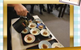
味噌にはガスバーナーで焦げ目を！