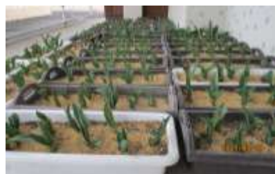
園庭のチューリップ♥ 今年は早く咲くかな