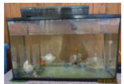
増島一番の癒しスポット 金魚さんの水槽★