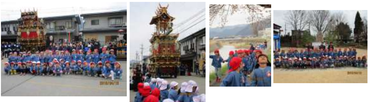
青龍台のからくりの奉納を見せていただきました。