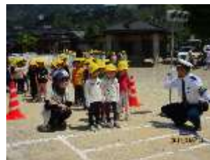
交通安全教室 5月13日