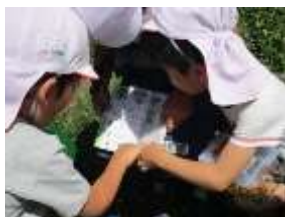
←図鑑を見ながら何の虫か？調べ中 ちょうちょを追いかけて