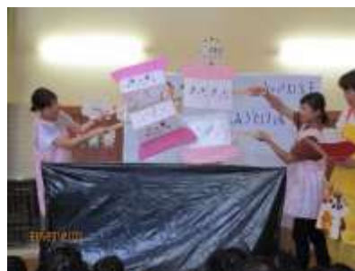
お話「まえばくんとおくばくん」