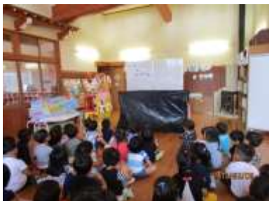
年少さん「健口教室」

9日に年少さん対象の「健口教室」が行われ、「まえばくんとおくばくん」のお話を聞き、磨き残しのチェックや正しい歯の磨き方を歯科衛生士さんに教えていただきました。また、近年、口の周りの筋肉が弱く、しっかりと噛むことが出来ない子が増えているとお話も伺いました。確かに噛めない子が多く、給食時に肉や繊維質の多いものが出されると苦戦している子がいます。中にはほとんど噛まずに飲み込む子も多く、驚くほど早食いの子もいます。健康の為にあまり好ましくありません。改善する方法として「あ」と大きく口をあける、「い」と横に広げる、「う」と口をすぼめる、「べ」と舌を出す「あいうべ体操」というお口の体操をする、口内の筋肉を柔らかくして動きをよくするマッサージ(口の中に指を入れて歯茎や頬の内側をマッサージ)すると良いと教えていただきました。これらの方法は滑舌や発音に心配があるなどの言語面の発達においても効果的で、「あいうべ体操」を保育の合間に取り入れているクラスもあります。大人の美容の為に効果があるようで、頬のリフトアップやほうれい線が目立たなくなるなどの利点があるそうですよ。親子でお口に良い事を試してみたいはいかがでしょうか？