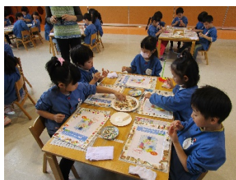
年長体験学習(写真立て作り)