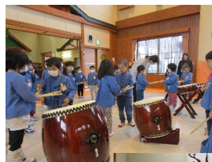
和太鼓引き渡し式 (年長→年中へ)