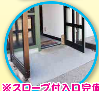
※スロープ付入口完備