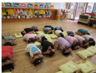
ダンゴ虫のポーズ