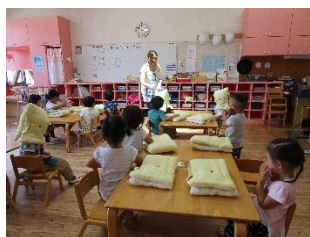
年少さん初めての訓練