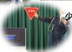
少・交通安全教室