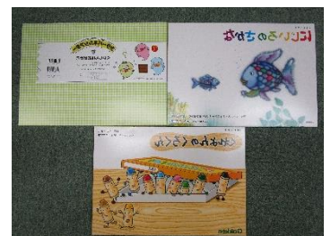
☆ありがとうございました

☆保護者会よりパネルシアター用の教材(「にじいろのさかな」「クレヨンにくろくん」「くいしんぼおぼけ号」)を寄贈いただきました。保育に活用させていただきます。ありがとうございました♡