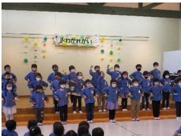
年長さん♡とのお別れ会

今年度も保護者の皆様をはじめご家族の皆さんと共にお子さんの成長を共に喜ぶことが出来たことに心より感謝を申し上げます。たくさんのご理解とご協力そして子どもたちを思う大きな愛で保育園を支えていただきましてありがとうございました。