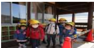
バス登園のお友だち