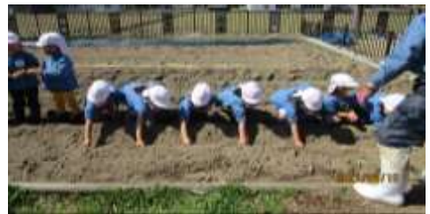
年長さんがジャガイモを植えました。