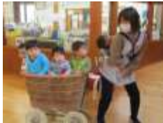
園内を乳母車で散策中