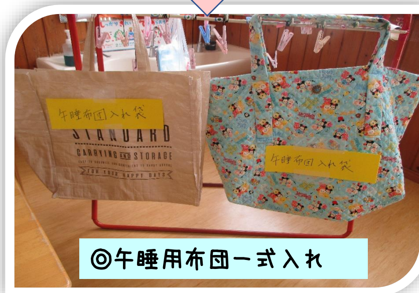
◎午睡用布団一式入れ