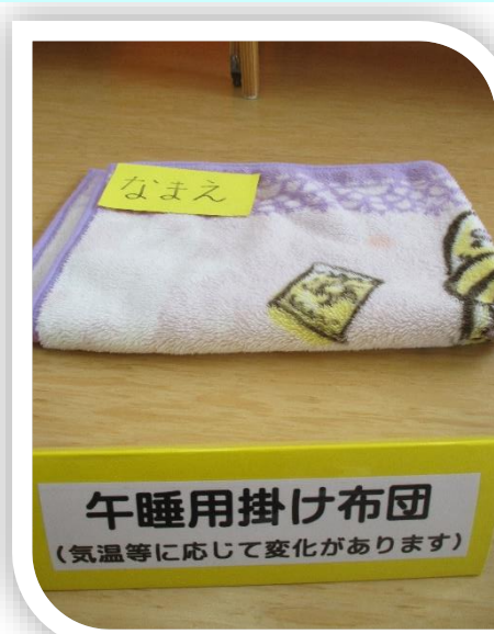
◎掛布団 (季節に応じて)