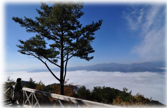
朝霧で人気の安房山のふもとです