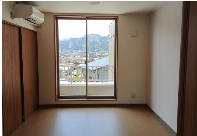
居室は照明、エアコン、収納を完備し、日当たりも良好